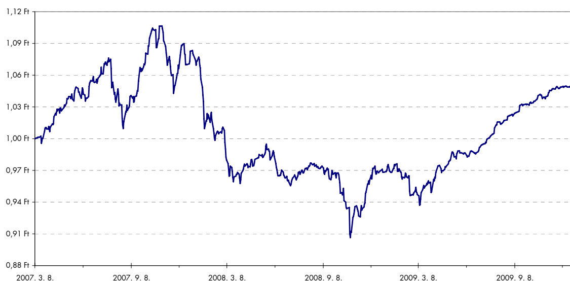
Raiffeisen Fix Mix Tőkegarantált Származtatott Alap

Az alap a táblázatban látható 3 portfólió legjobbjának az átlagos teljesítményéből nyújt részesedést a befektetők számára, miközben a befektetési politikája révén garantálja a befektetett tőke visszafizetését, és 10% minimális hozam megfizetését az alap futamidejének lejáratakor. A Mögöttes Portfóliók összetételét az alábbi táblázat rögzíti. Mivel a PSZÁF elfogadta 2008. folyamán az alapkezelőnek a Raiffeisen Ingatlan Alap felfüggesztése és átalakulása miatt benyújtott tájékoztatómódosítási kérelmét, így már a Mögöttes Portfóliók 2009. január 20-tól hatályos összetételét közli a táblázat.